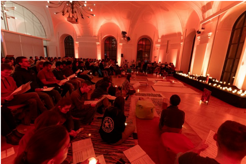
Nacht der Lichter (12.11.)

Das Krimi-Dinner stand in diesem Semester neu auf dem Programm: In einer (natürlich illegalen) Schankwirtschaft im Amerika der Prohibition gab es einen grausamen Mord. Ist der Täter noch unter uns? Wer könnte ein Motiv haben? Wie schaffe ich als Leiter dieses Etablissements, meine Affäre mit einer meiner Unterhaltungstänzerinnen vor meiner viel zu neugierigen Gattin geheim zu halten? So viel sei verraten: Dem Täter ist es bis zum Schluss gelungen, unerkannt zu blei-