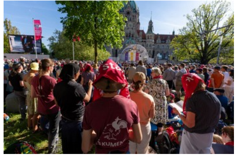
Evangelischer Kirchentag (30.4. – 5.4.)