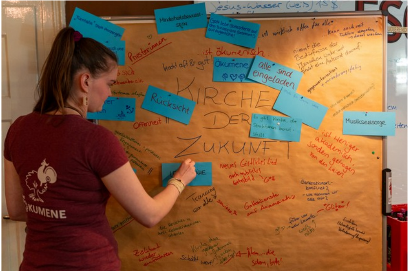
Zukunft der Kirche (1.4.)