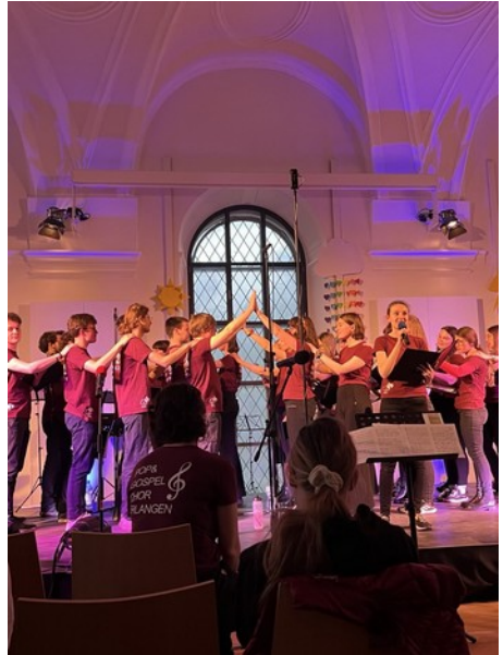
Sommerkonzert Pop- und Gospelchor