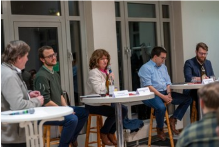
Wählen ja, aber wen (18.2.)